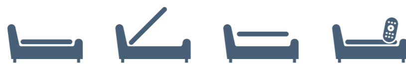
EASY CASE CASE X2 MATIC CASE