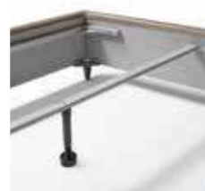
SUPPORTO RETI SINGOLE BAR FOR SINGLE BED FRAMES