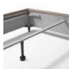
SUPPORTO RETI SINGOLE BAR FOR SINGLE BED FRAMES