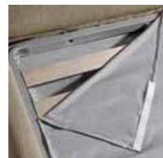
COPRIRETE BED BASE COVER