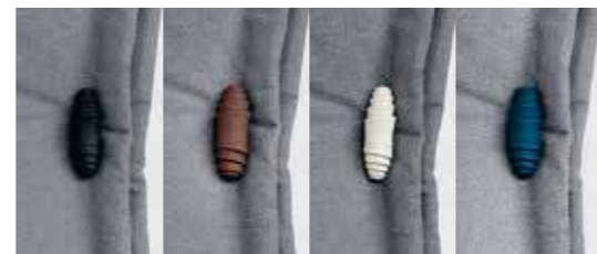
POSSIBILITÀ DI SCEGLIERE IL COLORE DELL'ALAMARO NERO • CIOCCOLATO • NEVE • BLUETTE IT IS POSSIBLE TO SELECT THE COLOUR OF THE TOGGLES BLACK • CHOCOLATE • SNOW • BRIGHT BLUE